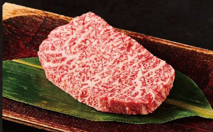
いわて牛厚切りブローズ 2,990円(税込)