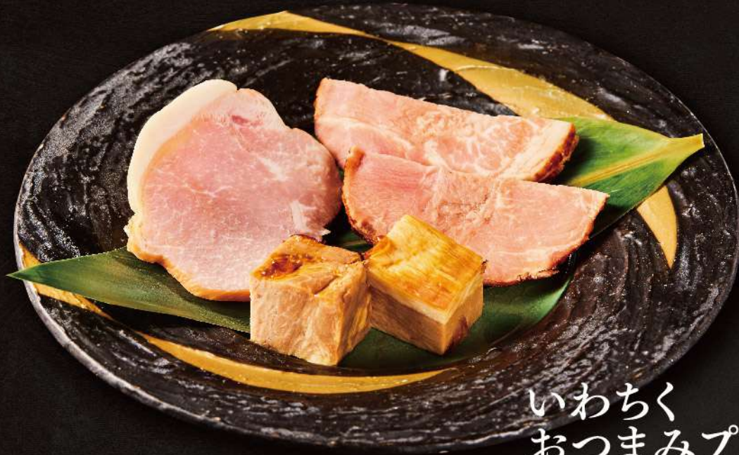
いわちく おつまみプレート 890円(税込)