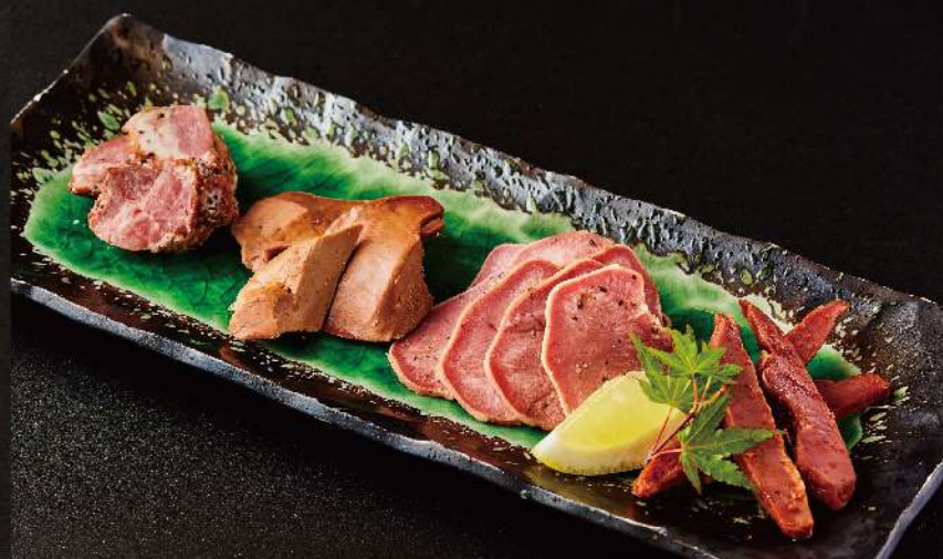
工場直送 豚スモーク盛合せ 790円(税込)