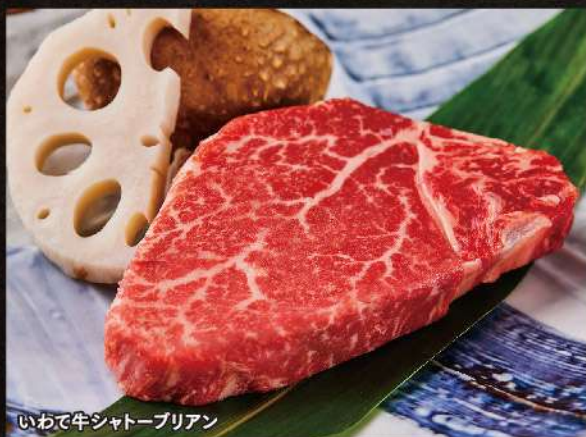
いわて牛シャトーブリアン