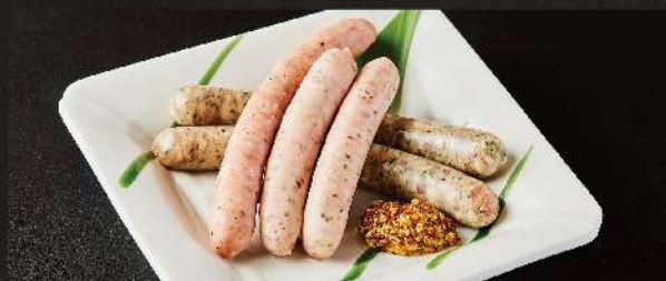
生ウインナー5種盛り合わせ