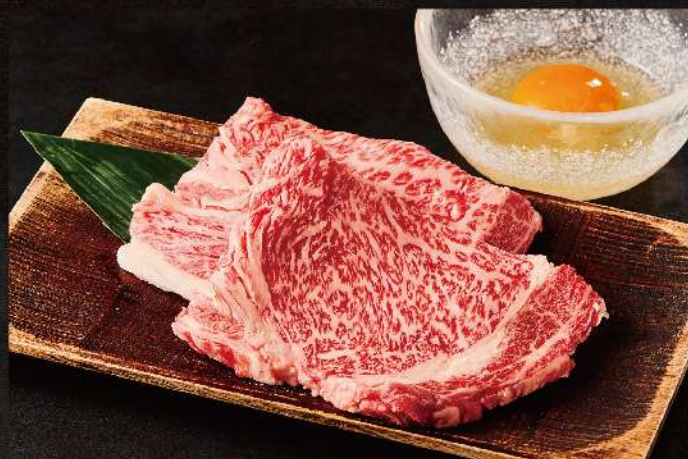
いわて牛サーロイン炙り 3,090円(税込)