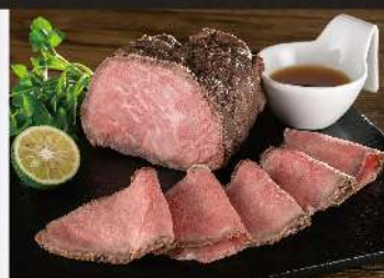
いわて牛ローストビーフ