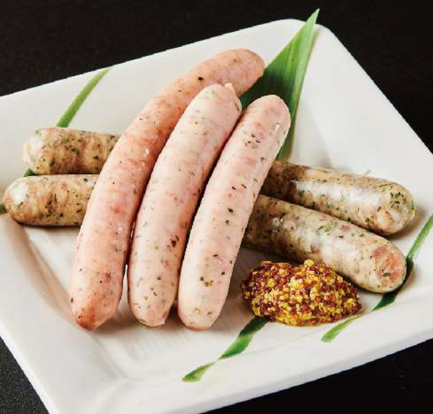
いわちく生ウインナー 5種 1,090円(税込)