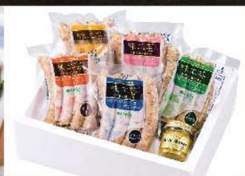
高原育ちのフレッシュウインナー詰合せセット