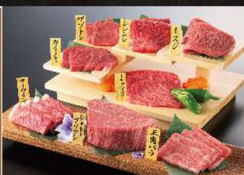
祝って牛希少部位特別セット(雪)