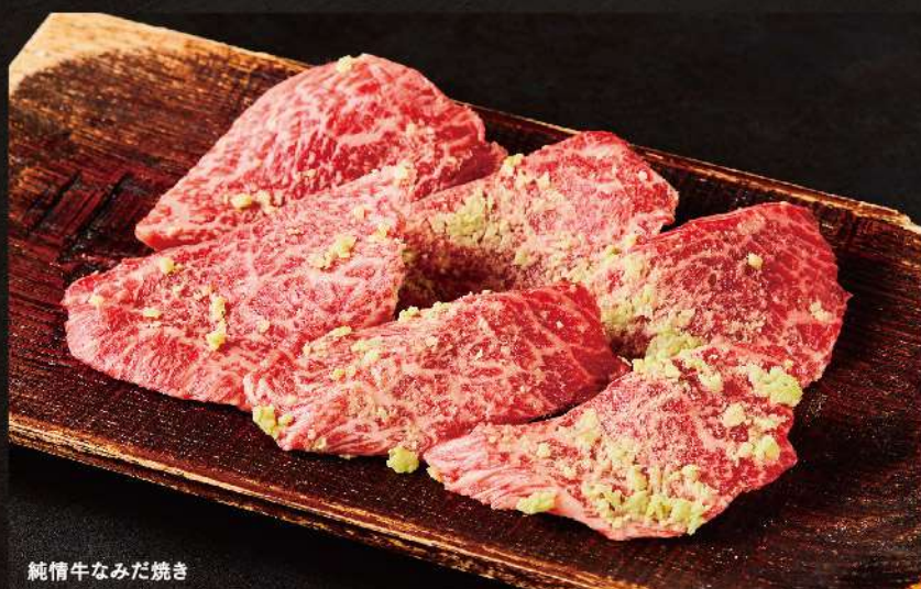
純情牛なみだ焼き